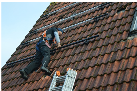
Het begint nu echt .....

De vergadering waar Bespaarpartner het aanbod presenteerde is op het moment waarop we dit schrijven nog geen maand geleden. In deze korte tijd zijn er inmiddels al bij acht woningen de panelen gelegd en geïnstalleerd en bij minstens hetzelfde aantal in voorbereiding. We mogen dus wel spreken van een zeer geslaagde actie en ook een hoog tempo. Als u alsnog mee zou willen doen met deze actie en de vroegboekorting (tot eind februari) kunt u zich nog rechtstreeks aanmelden bij Bespaarpartner. Zij komen dan vrijblijvend bij u langs om in uw specifieke situatie een offerte te doen. Bovendien krijgt het dorp ook een bijdrage van Bespaarpartner. U hoeft alleen telefonisch een afspraak te maken met 0521-764012.