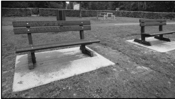
Afbeelding: de bankjes