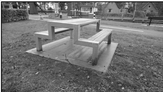
Afbeelding: de tafel

De bankjes zijn geplaatst op een betonplaat. Dit is makkelijk bij het opruimen van het zwerfvuil dat helaas nog vaak wordt achtergelaten. Ook kunnen de honden nu geen diepe gaten meer graven onder en vlakbij de bankjes.