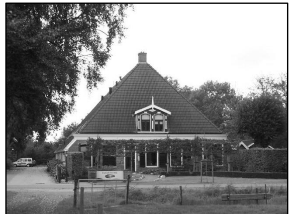
Afbeelding: de oude Brasserie De Stal in Nieuwe-schoot

Per 6 november 2023 is de brasserie van De Stal definitief gesloten. Bij de nieuwe locatie aan de van Bienemalaan in Oranjewoud kan men in de nabije toekomst vast wel weer terecht voor een hapje en een drankje.