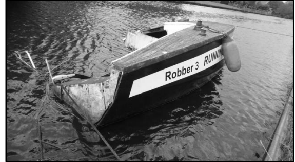
Afbeelding: het half gezonken bootje

Even ten westen van de brug ligt een verwaarloosd bootje dat al half onder water ligt. Nu de gemeente bezig is met een opknopbeurt van het Heidemeer zou het niet meer dan logisch zijn dat dit bootje wordt weggehaald. Ik Zag laatst mensen van handhaving erbij staan dus hopelijk wordt er nu actie ondernomen.